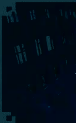
PLC 控制技术 训练场所